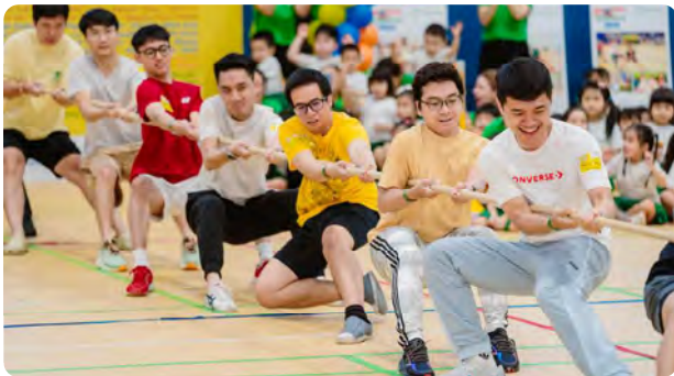
Parents and children enthusiastically engaged in the activities at the Inaugural Sports Fiesta 2025 Phụ huynh và bé nhiệt tình tham gia các hoạt động trong Ngày hội thể thao lần đầu tiên năm 2025

KinderFit là chương trình rèn luyện thể chất kết hợp vận động tim mạch dành cho trẻ, khơi gợi tinh thần vận động, xây dựng lối sống lành mạnh ngay từ những năm đầu đời. Thông qua các trò chơi và bài tập thú vị, trẻ được phát triển sự tự tin, khả năng vận động linh hoạt và tinh thần đồng đội. Ngày 12/4/2025, Kinderland Việt Nam tổ chức thành công Ngày hội Thể thao lần đầu tiên, sự kiện sôi động thu hút hơn 120 gia đình tham gia, lan tỏa niềm vui vận động, gắn kết các thành viên với nhau.