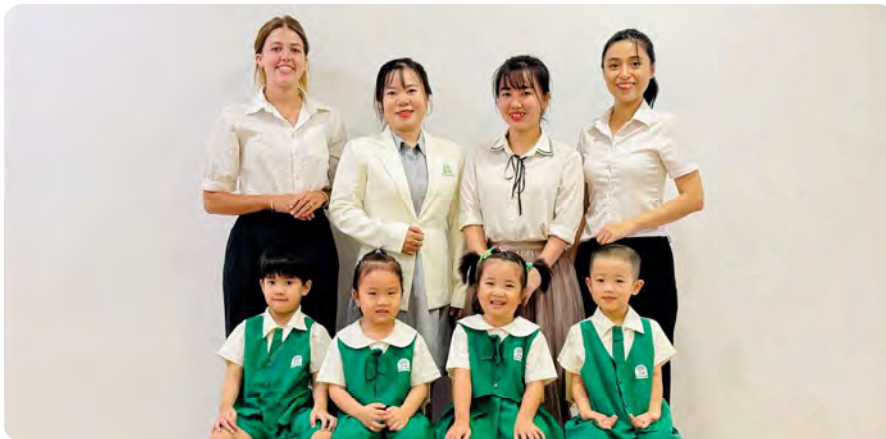
From Left to Right / Từ trái sang phải

Kinderland International Preschool @ Le Thi Rieng / Trường Mầm non Quốc tế Kinderland @ Lê Thị Riêng