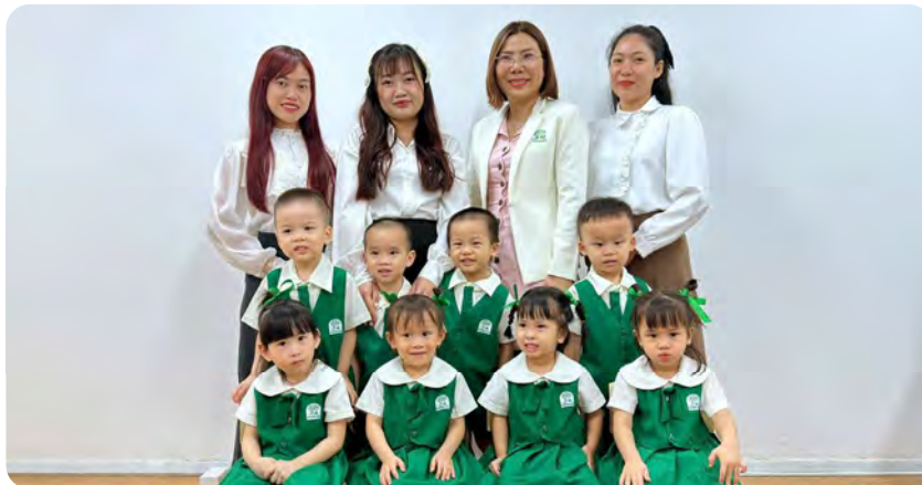
From Left to Right / Từ trái sang phải

Kinderland International Preschool @Tan Dinh / Trường Mầm non Quốc tế Kinderland @Tân Định