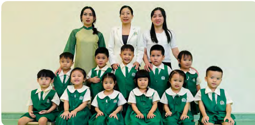
From Left to Right / Từ trái sang phải

Kinderland International Preschool @ Vista Verde / Trường Mầm non Quốc tế Kinderland @ Vista Verde