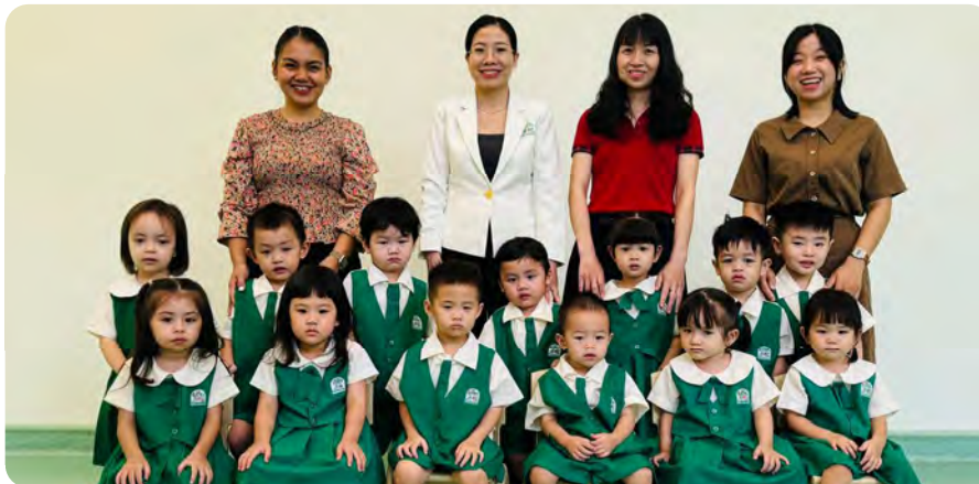
From Left to Right / Từ trái sang phải

Kinderland International Preschool @ Vista Verde / Trường Mầm non Quốc tế Kinderland @ Vista Verde