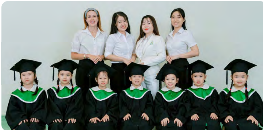
From Left to Right / Từ trái sang phải

Kinderland International Preschool @ Le Thi Rieng / Trường Mầm non Quốc tế Kinderland @ Lê Thị Riêng