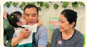
Children express their love for their grandparents Bé thể hiện tình yêu với Ông Bà