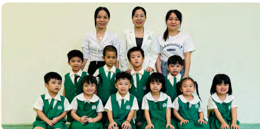
From Left to Right / Từ trái sang phải

Kinderland International Preschool @ Vista Verde / Trường Mầm non Quốc tế Kinderland @ Vista Verde