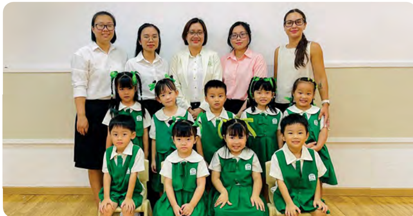
From Left to Right / Từ trái sang phải

Kinderland International Preschool @ Tran Nao / Trường Mầm non Quốc tế Kinderland @ Trần Nào