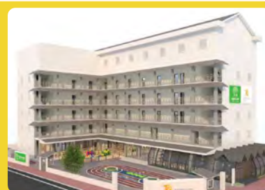
Kinderland @ Phnom Penh Cambodia