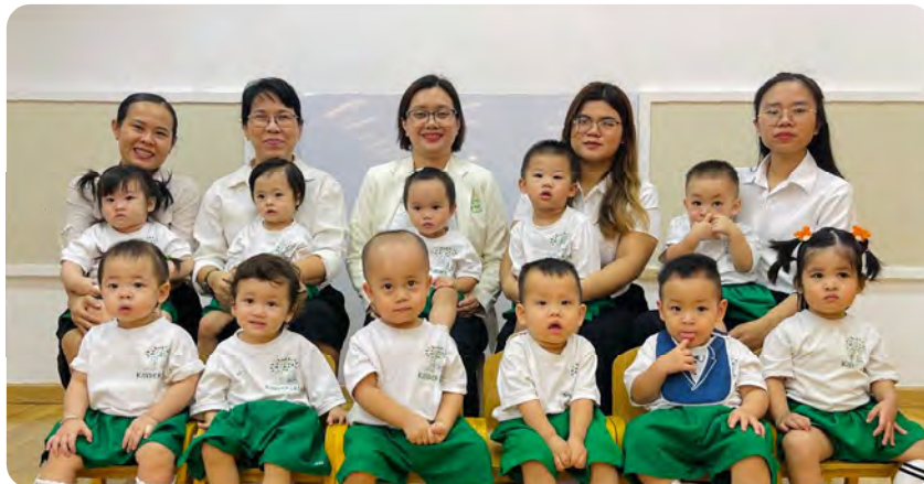
From Left to Right / Từ trái sang phải

Kinderland International Preschool @ Tran Nao / Trường Mầm non Quốc tế Kinderland @ Trần Nào