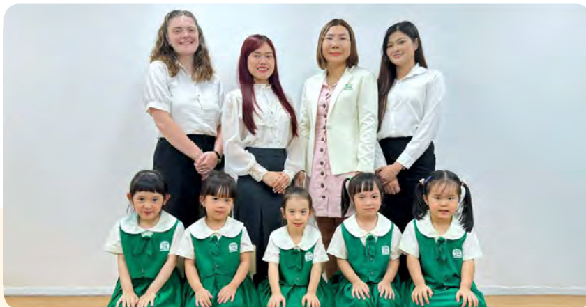
From Left to Right / Từ trái sang phải

Kinderland International Preschool @Tan Dinh / Trường Mầm non Quốc tế Kinderland @Tân Định