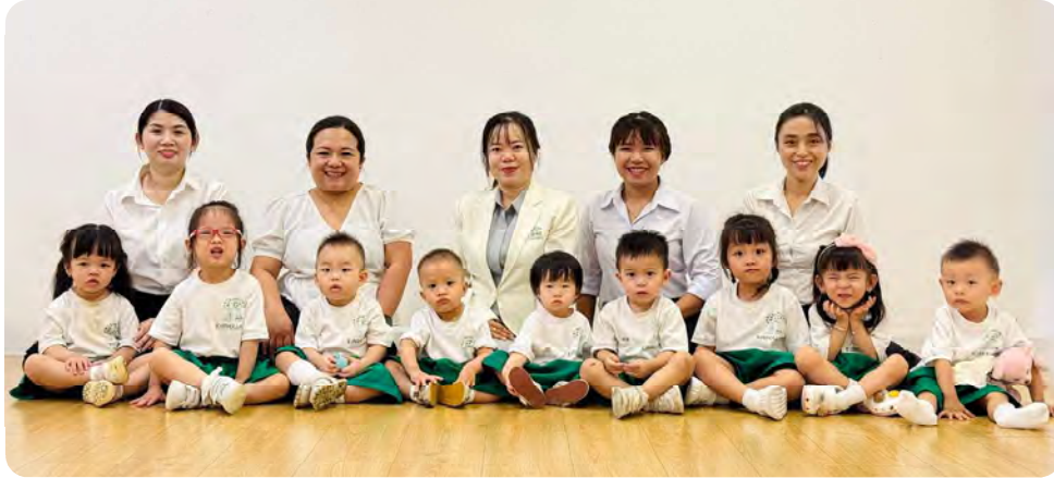
From Left to Right / Từ trái sang phải

Kinderland International Preschool @ Le Thi Rieng / Trường Mầm non Quốc tế Kinderland @ Lê Thị Riêng