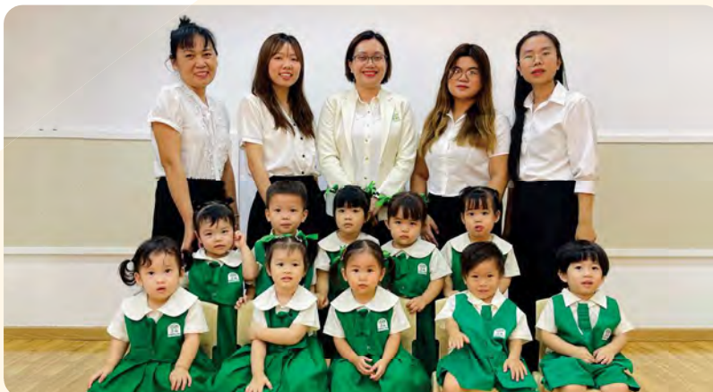
From Left to Right / Từ trái sang phải

Kinderland International Preschool @ Tran Nao / Trường Mầm non Quốc tế Kinderland @ Trần Nào