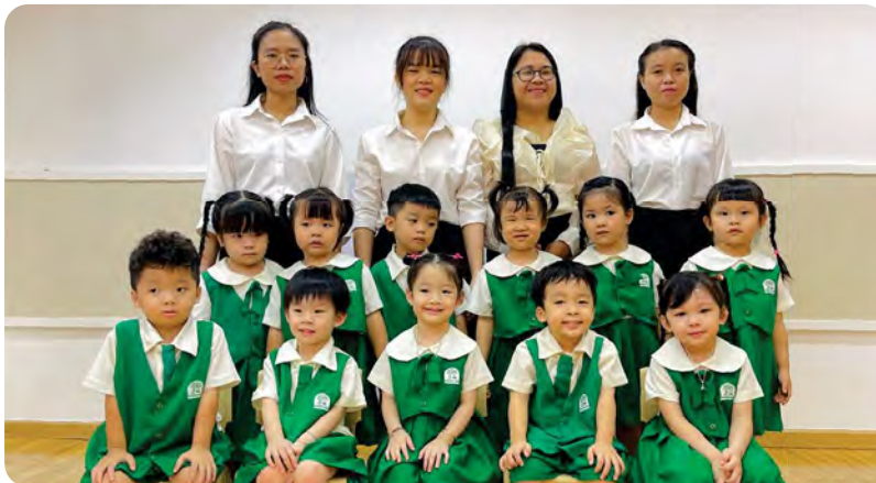
From Left to Right / Từ trái sang phải

Kinderland International Preschool @ Tran Nao / Trường Mầm non Quốc tế Kinderland @ Trần Nào