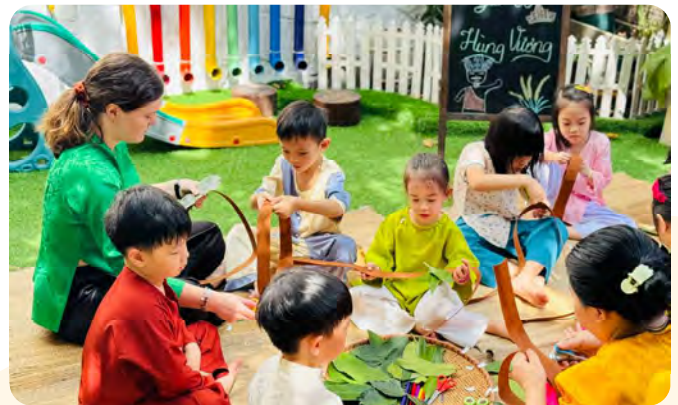
Children had a fun time making sticky rice cakes Các bé thích thú gói bánh chưng, bánh giầy