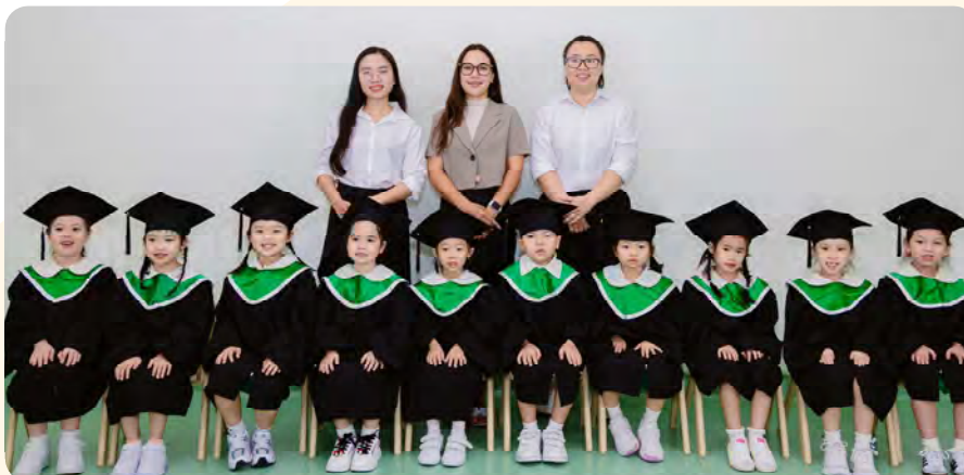
From Left to Right / Từ trái sang phải

Kinderland International Preschool @ Tran Nao / Trường Mầm non Quốc tế Kinderland @ Trần Nào