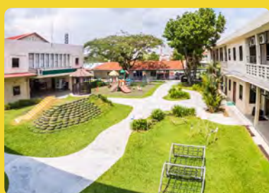
Kinderland Academy @ Yio Chu Kang Singapore