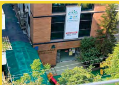
Kinderland @ Dhaka Bangladesh