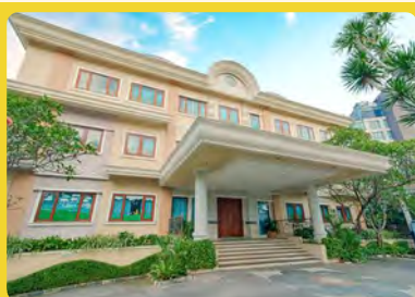
Kinderland @ Pondok Indah South Jakarta, Indonesia