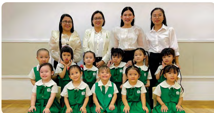
From Left to Right / Từ trái sang phải

Kinderland International Preschool @ Tran Nao / Trường Mầm non Quốc tế Kinderland @ Trần Nào