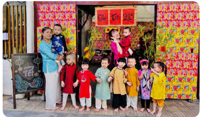
Tet event at Kinderland @ Tan Dinh Lễ hội Tết tại Kinderland @ Tân Định

Tết là dịp vui tươi, đầm ấm khi các gia đình quây quần, cùng nhau diện trang phục đẹp và chúc mừng năm mới. Tại Kinderland, Tết còn là dịp để lan tỏa yêu thương và sẻ chia với những mảnh đời kém may mắn. Như một truyền thống hằng năm, các em nhỏ tự tay làm những sản phẩm thủ công xinh xắn để bán gây quỹ trong Hội Chợ Tết, cùng với nhiều hoạt động thiện nguyện khác.