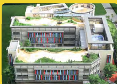
Kinderland @ Zhuhai China