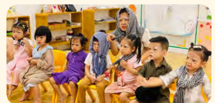
Children dressed up and role-played as grandparents Các bé hóa trang, nhập vai thành Ông Bà