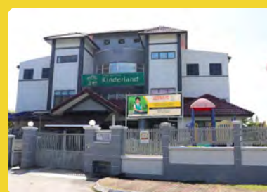
Kinderland @ USJ 11, Kuala Lumpur, Malaysia