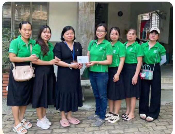
Kinderland staff and teachers presented the Tet fundraising donation to the representative of Thi Nghe Orphanage for Disabled Children / Số tiền gây quỹ trong dịp Tết đã được nhân viên & giáo viên Kinderland trao tận tay cho đại diện Trung tâm Trẻ mồ côi khuyết tật Thị Nghè

Chúng tôi hy vọng sẽ tiếp tục duy trì và lan tỏa những hoạt động thiện nguyện ý nghĩa, góp phần mang lại tình yêu thương và những thay đổi tích cực cho cộng đồng.