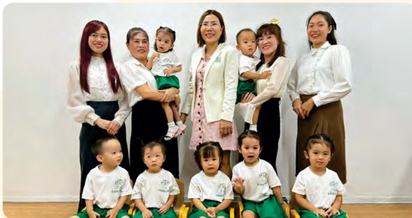
From Left to Right / Từ trái sang phải

Kinderland International Preschool @Tan Dinh / Trường Mầm non Quốc tế Kinderland @Tân Định