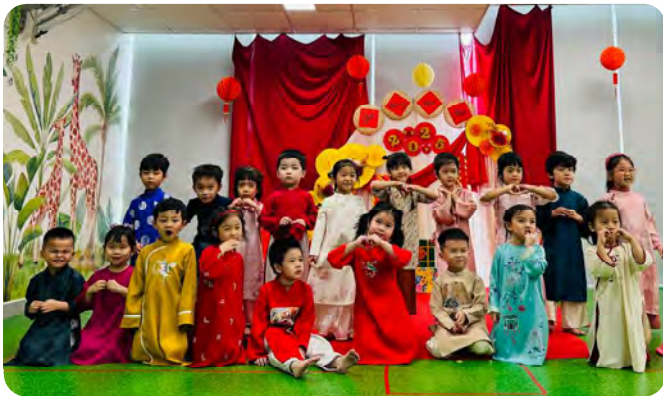
Tet event at Kinderland @ Vista Verde Lễ hội Tết tại Kinderland @Vista Verde

Funds raised from the event were used to purchase food, milk, and daily necessities for the Thi Nghe Orphanage for Disabled Children. This meaningful gesture brought smiles and warmth to many, reflecting Kinderland's values of compassion, generosity, and community spirit. Together, we hope to continue building more impactful charity initiatives that spread love and make a difference in the lives of others.