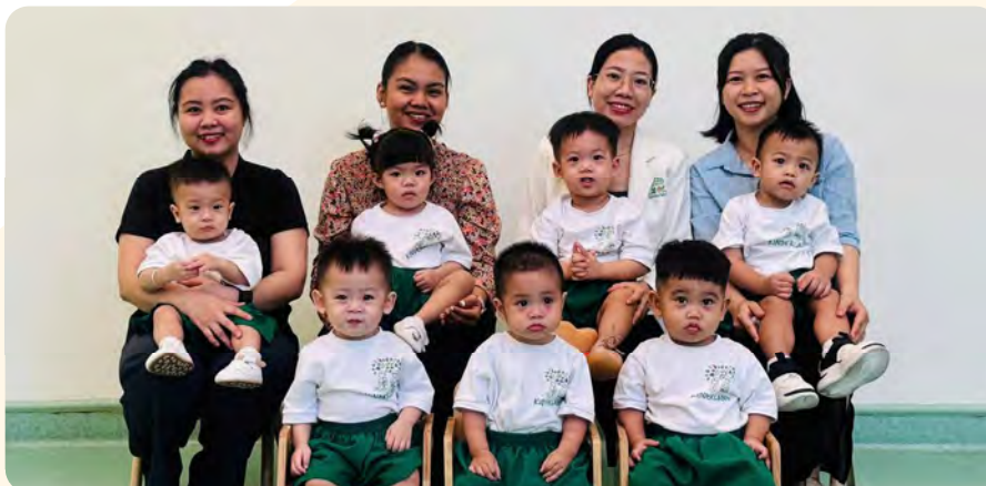
From Left to Right / Từ trái sang phải

Kinderland International Preschool @ Vista Verde / Trường Mầm non Quốc tế Kinderland @ Vista Verde