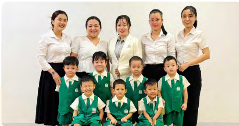
From Left to Right / Từ trái sang phải

Kinderland International Preschool @ Le Thi Rieng / Trường Mầm non Quốc tế Kinderland @ Lê Thị Riêng