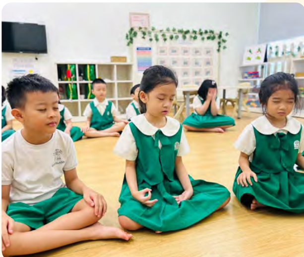
Children closed eyes and followed the teacher's instruction Trẻ nhắm mắt và làm theo hướng dẫn của giáo viên