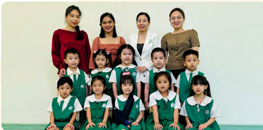
From Left to Right / Từ trái sang phải

Kinderland International Preschool @ Vista Verde / Trường Mầm non Quốc tế Kinderland @ Vista Verde