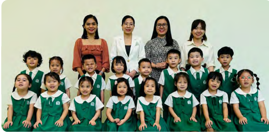
From Left to Right / Từ trái sang phải

Kinderland International Preschool @ Vista Verde / Trường Mầm non Quốc tế Kinderland @ Vista Verde