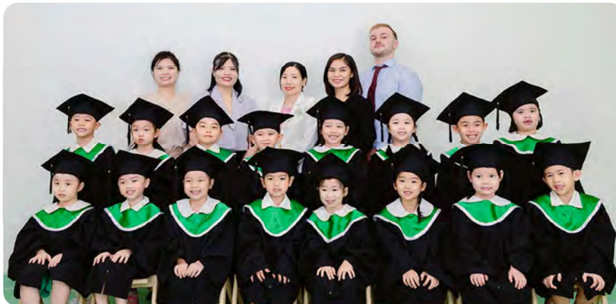
From Left to Right / Từ trái sang phải

Kinderland International Preschool @ Vista Verde / Trường Mầm non Quốc tế Kinderland @ Vista Verde