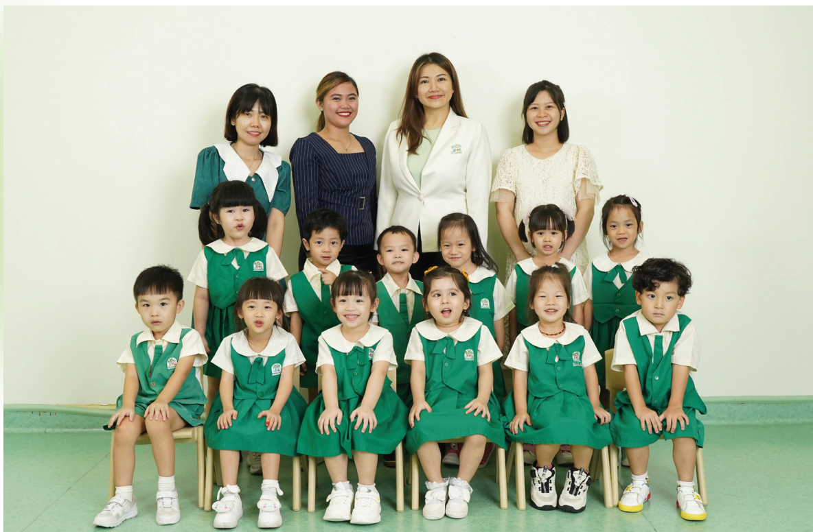
From Left to Right/Từ trái sang phải