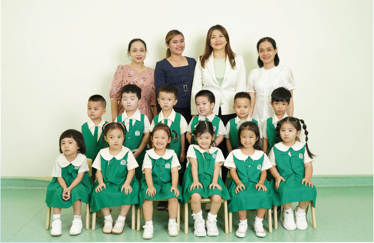
From Left to Right/Từ trái sang phải