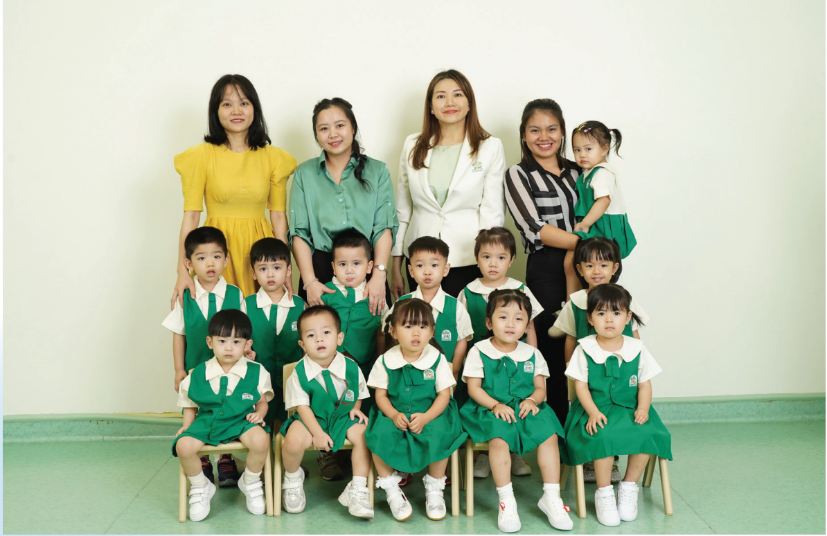
From Left to Right/Từ trái sang phải