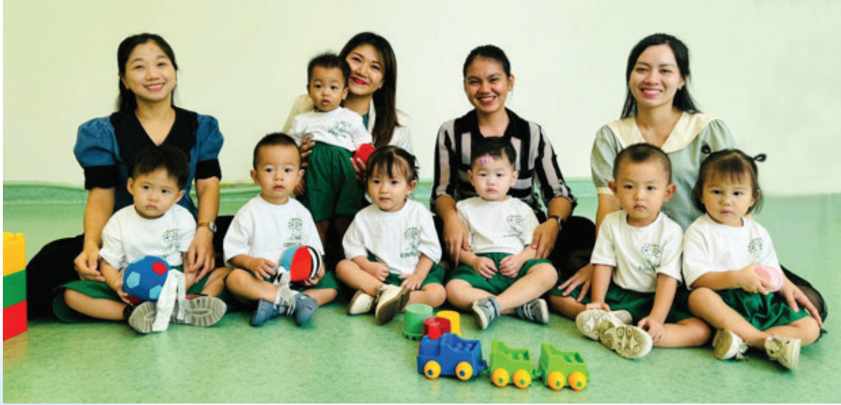
From Left to Right/Từ trái sang phải