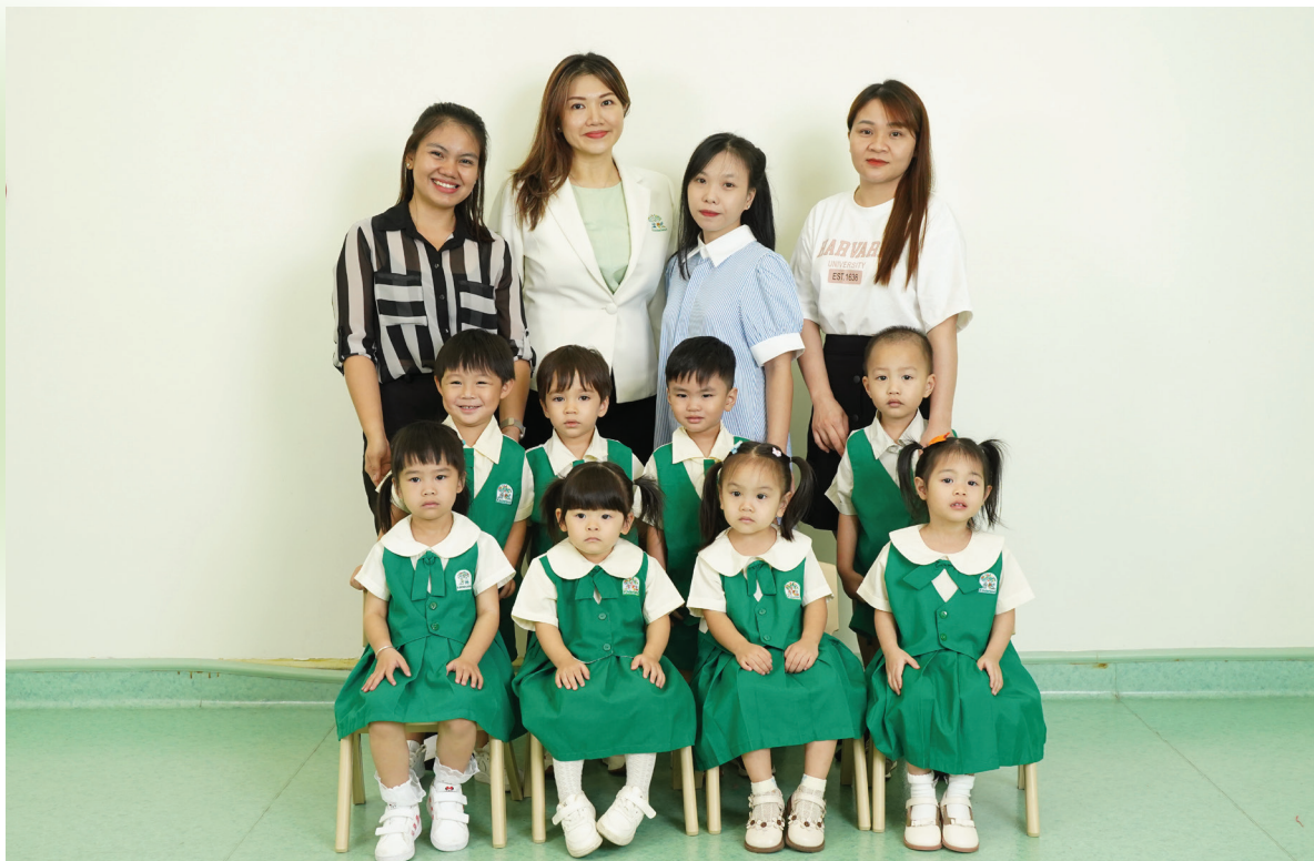
From Left to Right/Từ trái sang phải