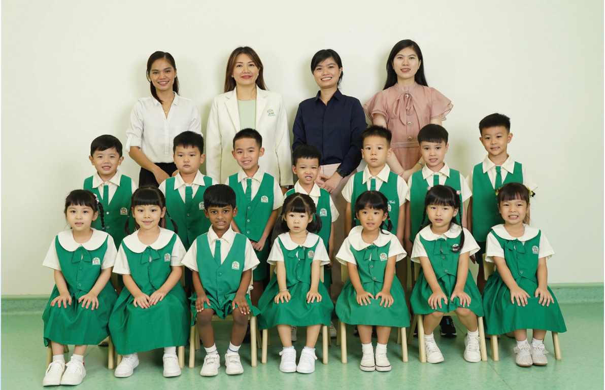
From Left to Right/Từ trái sang phải